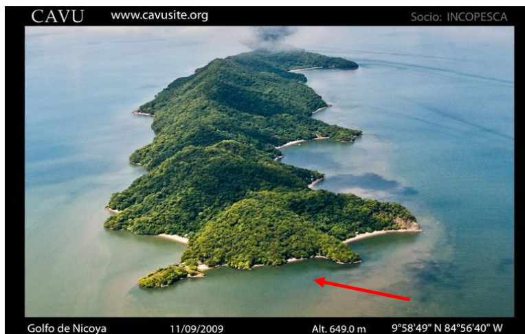
Foto 1: Isla Caballo en donde la flecha marca el sitio donde se creará el AMPR de esa comunidad.