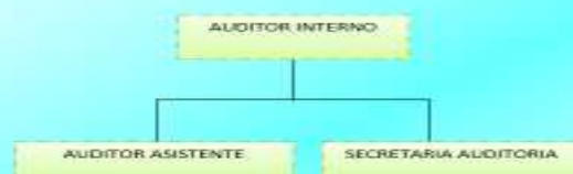
Estructura Organizativa de la Auditoria Interna