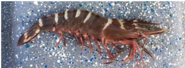
Penaeus monodon Camarón tigre 35 cm