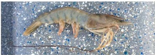
Penaeus schmitti Camarón jumbo o blanco 23 cm