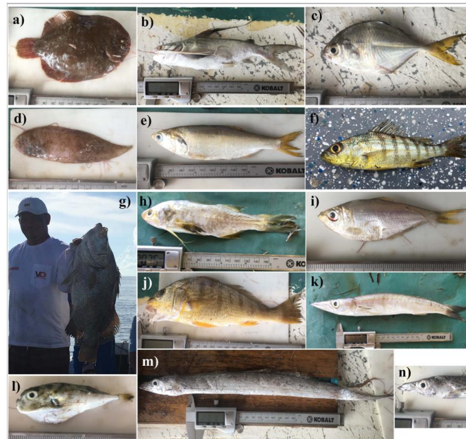
Figura 6. Algunos de los peces capturados como fauna acompañante del camarón en Barra del Colorado, Caribe Norte de Costa Rica: a) el lenguado Achirus declivis (Achiridae), b) el cuminate Bagre marinus (Ariidae), c) el jurel Hemicaranx amblyrhynchus (Carangidae), d) el lenguado Symphurus sp. (Cynoglossidae), e) la anchoa Cetengraulis edentulus (Engraulidae), f) el roncador Conodon nobilis (Haemulidae), g) el arenero Lobotes surinamensis (Lobotidae), h) el bobo Polydactylus virginicus (Polynemidae), i) la sardina Pellona harroweri (Pristigasteridae), j) la corvina Umbrina broussonneti (Sciaenidae), k) la barracuda Sphyraena guachancho (Sphyraenidae), l) el timburil Sphoeroides pachygaster (Tetraodontidae), y m-n) el machete o cinta Trichiurus lepturus (Trichiuridae).