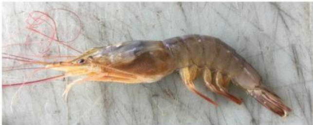
Xiphopenaeus kroyeri Camarón tití 14 cm

Identificar las especies de camarón que son de importancia comercial y su fauna de acompañamiento.