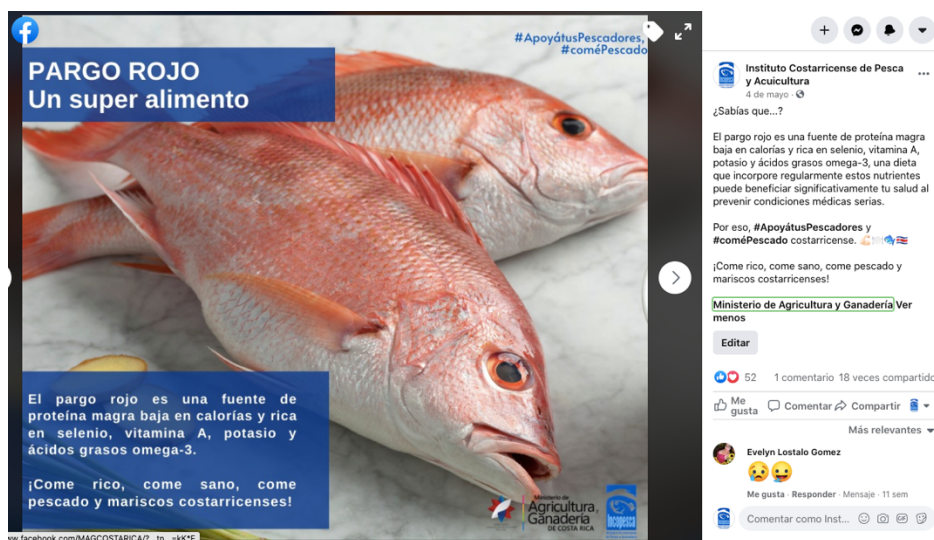
Imagen No 10: Publicación “Pargo, Un super alimento”.