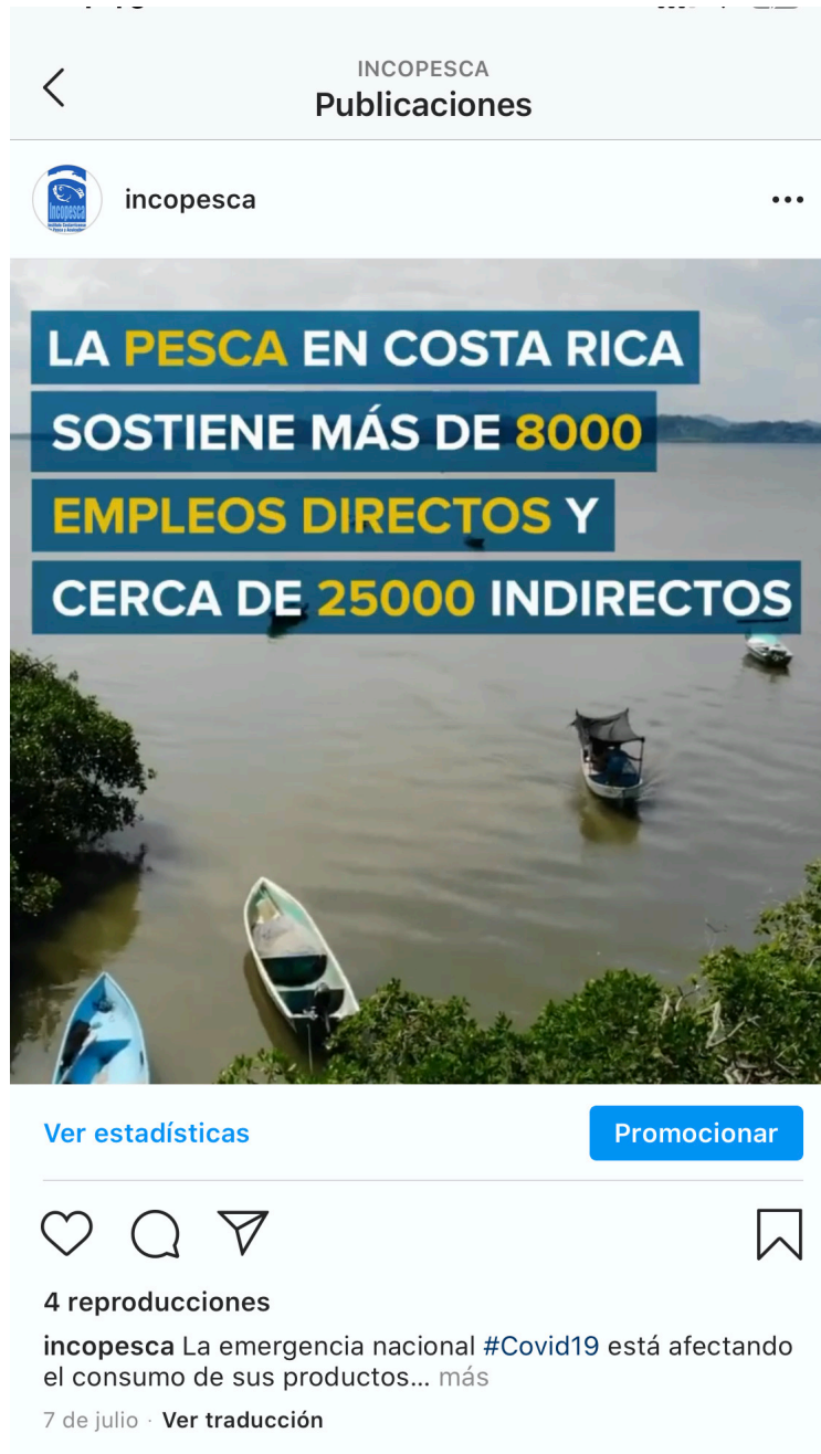
Imagen No 7: Publicación del primer vídeo corto en el perfil institucional de Instagram.