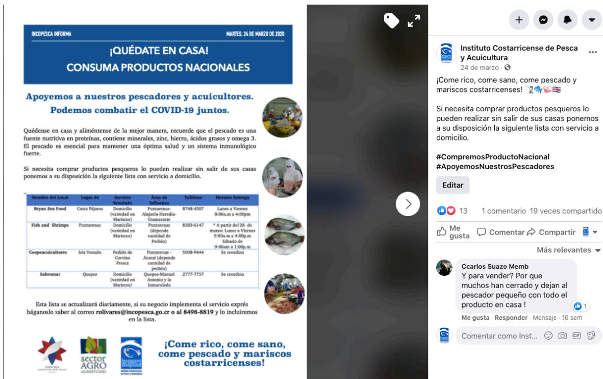
Imagen No 3: Publicación “Establecimientos que ofrecen servicios a domicilio” en el perfil institucional de Facebook.