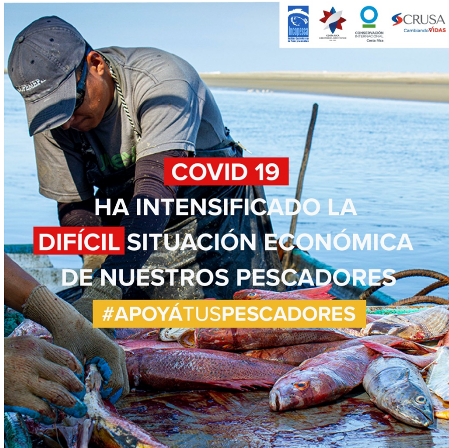
Imagen No 8: Publicación de apoyo al sector pesquero en el marco de la pandemia.