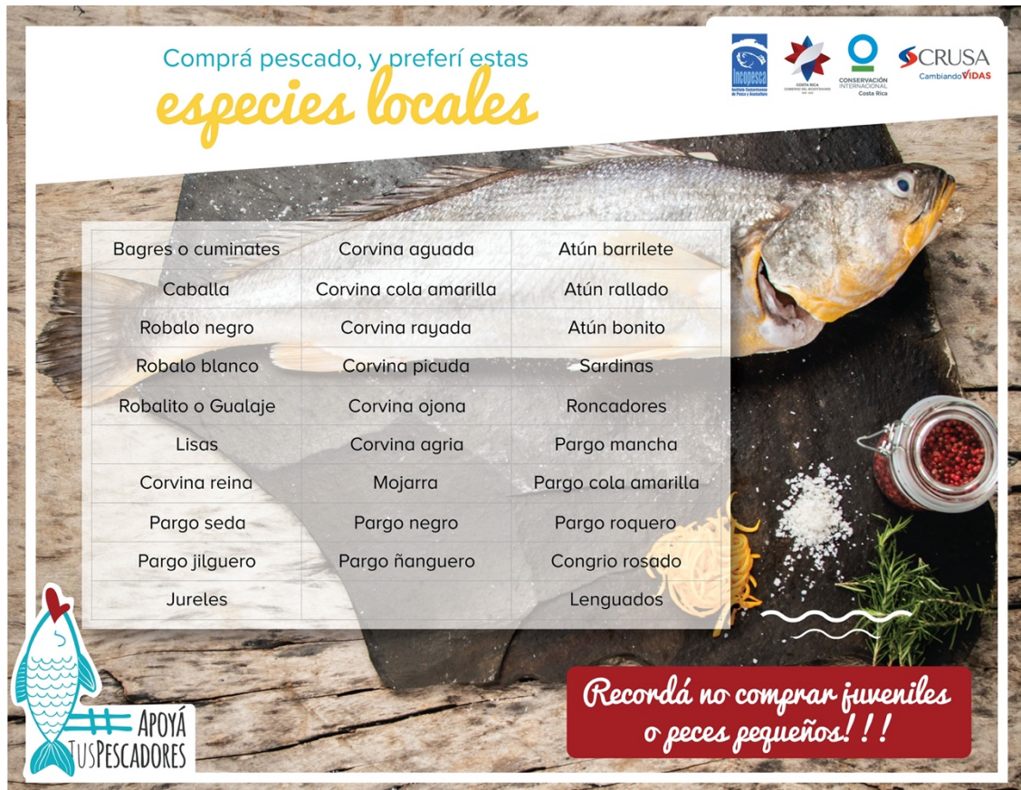
Imagen No 5: Publicación “Especies locales de pescado” publicado en el perfil institucional de Facebook.

Fuente: Inopesca 2020, Publicación realizada el 09 de abril del 2020, disponible en el link https://www.facebook.com/Inopesca/photos/a.1954855181464614/2716163305333794