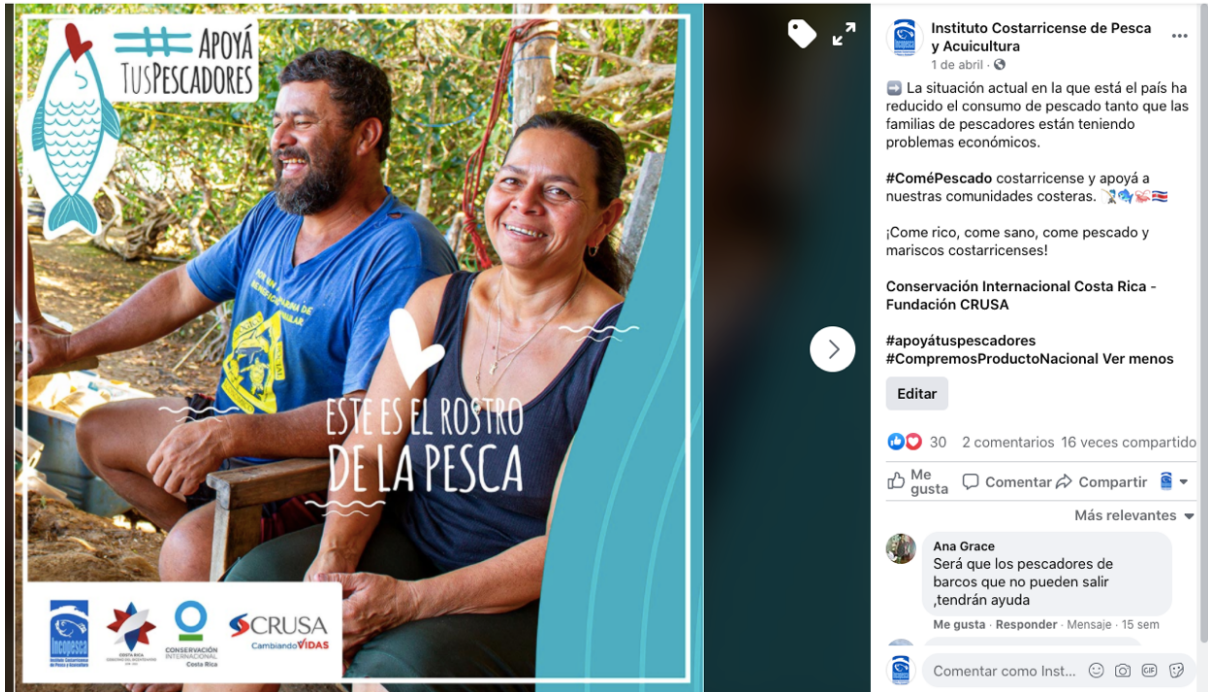
Imagen No 2: Publicación “Este es el rostro de la pesca” en el facebook institucional.