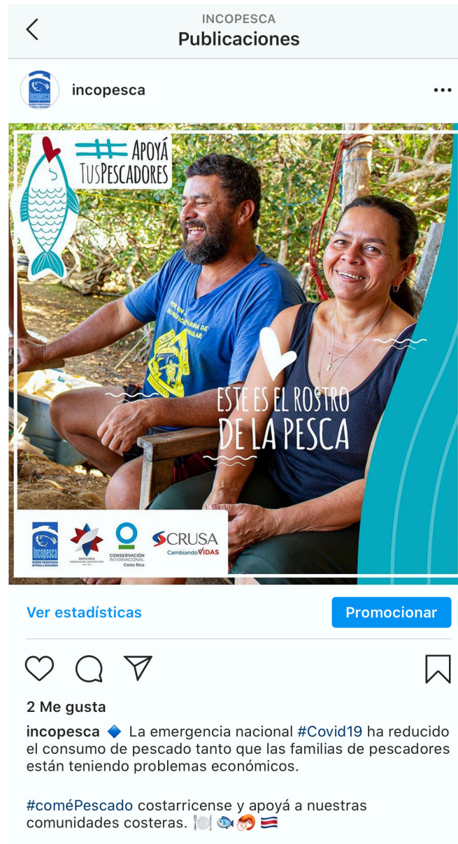
Imagen No 3: Publicación “Este es el rostro de la pesca” en el perfil institucional de Instagram.