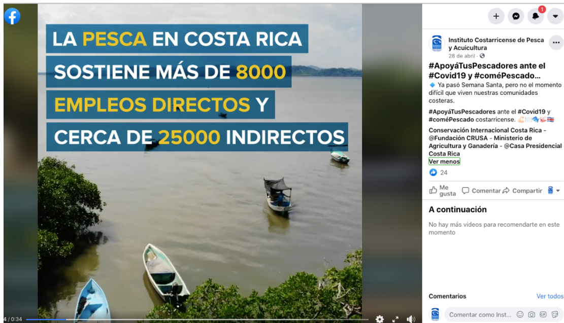
Imagen No 6: Publicación del primer vídeo corto en el perfil institucional de Facebook.