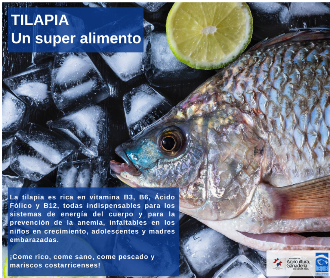
Imagen No 9: Publicación “Tilapia, Un super alimento”.