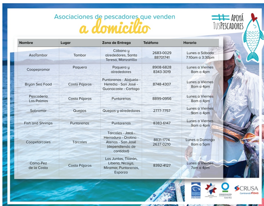
Imagen No 4: Publicación “ Establecimientos que ofrecen servicios a domicilio ” en el perfil institucional de Facebook.