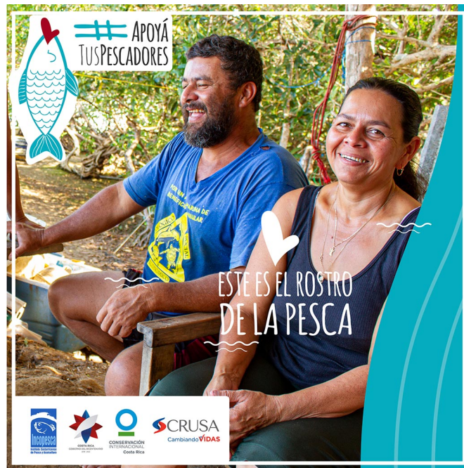
Imagen No 1: “Este es el rostro de la pesca”, con el cual se busca sensibilizar a la población y mostrar el rostro humano de las familias que viven del sector pesquero y acuícola.