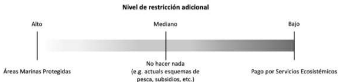
Figura 2. Nivel de restricción de las alternativas que podrían ser consideradas por el gobierno de Costa Rica para gestionar sosteniblemente la pesca

Se presentan 3 alternativas para la gestión de los recursos marino-costeros, con énfasis en la actividad pesquera. Cada alternativa presenta un nivel de restricción adicional diferente, desde un enfoque totalmente prohibitivo (i.e. áreas marinas protegidas) hasta un enfoque de incentivos (i.e. PSEM).