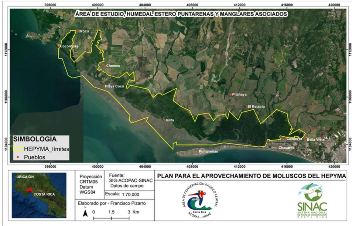
Figura 1.- Ubicación del Área Silvestre Protegida Humedal Estero Puntarenas y Manglares Asociados.

7- Que se determinó que, en función del inventario disponible para extracción de pianguas, almeja blanca, chora y mejillón navaja que corresponden a los individuos que cumplen con la talla legal de primera captura, se dispone de 15,7 millones de moluscos disponibles para extraer por un año calendario, lo que representa una extracción mensual para los cinco grupos de moluscos de 1,3 millones de individuos (Tabla 1).