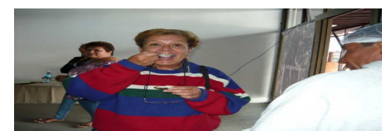
PARTICIPACION EN CAPACITACIONES MODULO PREVENCIÓN CONTRA EL FUEGO