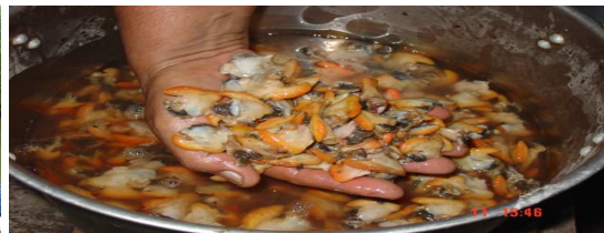
PARTICIPACION EN FERIAS Y COMERCIALIZACION DE OSTRAS