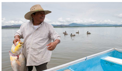
Pescador de Palito, Isla de Chira

La región Pacífico Central es la que concentra la mayor cantidad de AMPR con 5 de ellas, lo que implica una cobertura 228.3 km 2 , o sea un 22% del área marina bajo este modelo de gestión, con 407 familias beneficiadas. Destaca en área de cobertura la Región Brunca, con el AMPR de Golfo Dulce con 750 km 2 (72,5% del área total) y una población beneficiada de 500 familias.