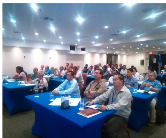
Fuente Incopecsa, presentación resultados diagnóstico acuícola. 2015