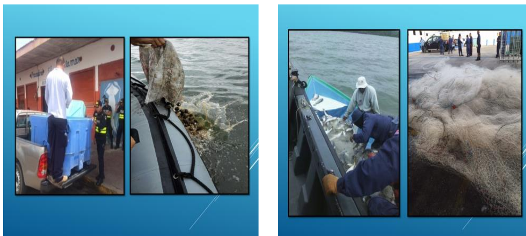
Operativos Incopescas, pesca ilegal, artes de pesca ilegales. 2015

Con el apoyo del Servicio Nacional de Guardacostas, del Servicio Nacional de Salud Animal (SENASA) y la Fuerza Pública, entre otras, se logró realizar aproximadamente 17.000 operativos de control y vigilancia en diferentes regiones del país, (Chorotega, Brunca, Pacífico Central y Caribe) para una inversión de ₡ 474.000.000.