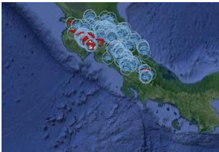
Mapa NASO Costa Rica, proyectos acuícolas georreferenciados.

El diagnóstico es una excelente herramienta con base a la cual se espera una planificación ordenada y sustentable de la actividad acuícola en el país; siendo que para el año 2018 se inicia, con el apoyo y cooperación de la FAO, el trabajo de elaboración del Plan de Acción 2018 – 2028 para el Desarrollo de la Acuicultura.