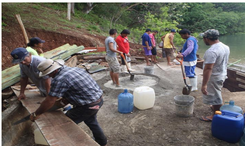
Pescadores trabajo comunal período de veda.