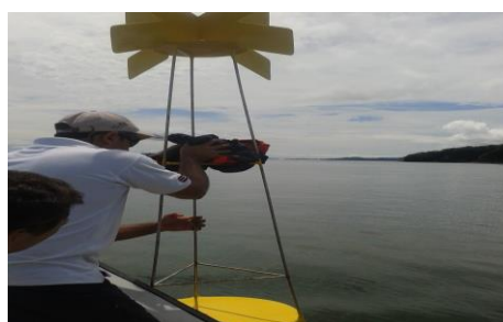
Instalación de Boyas

AMPR, GOLFO DULCE. Extensión de 750 km 2 , con 500 familias beneficiarias, siendo la pesca artesanal y actividades asociadas como la principal fuente de ingresos. Esta Área fue constituida con la participación inicial de siete asociaciones, de las cuales se mantienen cinco. El principal efecto desde la creación de esta área, es el incremento en la biomasa, lo que ha repercutido en la mejora de las capturas y en ingreso de los pescadores.