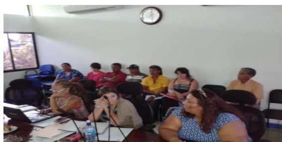
Presentación Plan Ordenamiento Isla Venada a Junta Directiva, INCOPECA

Establecimiento del AMPR LA FLORIDA, ISLA VENADO. El 6 de diciembre, 2013 se aprobó la propuesta de Plan de Ordenamiento Pesquero, para dar inicio a su ejecución en el 2014. Esta Área tiene una extensión de 2,5 Km 2 , con 32 familias beneficiarias de la pesca artesanal y otras actividades relacionadas como turismo, que son la principal fuente de ingresos.