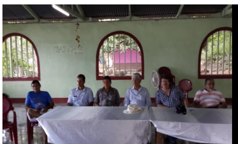
Visita Isla Caballo, Vicepresidente