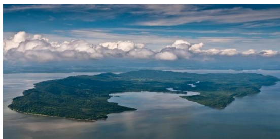
Isla de Chira

En este año, se colocaron 8 boyas para delimitar la zona, con un costo de ¢ 8 millones, para lo cual se contó con la colaboración de la ONG, Conservación Internacional. También se desarrolla el proyecto de Ostras en la Comunidad de Palito, con el acompañamiento del INCOPECSA, cuya producción fue de 25 mi ostras, con un costo por unidad de ¢ 300 c/u, lo que implica un ingreso de ¢ 7,5 millones, para 12 familias beneficiadas.